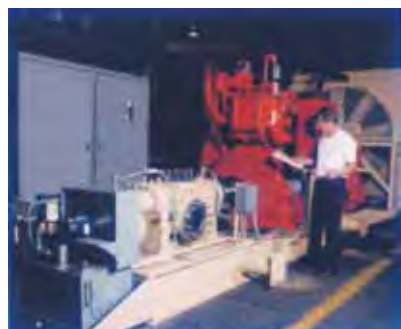
Типовой насос с приводом на природном газе для перекачивания сырой нефти по трубопроводу.